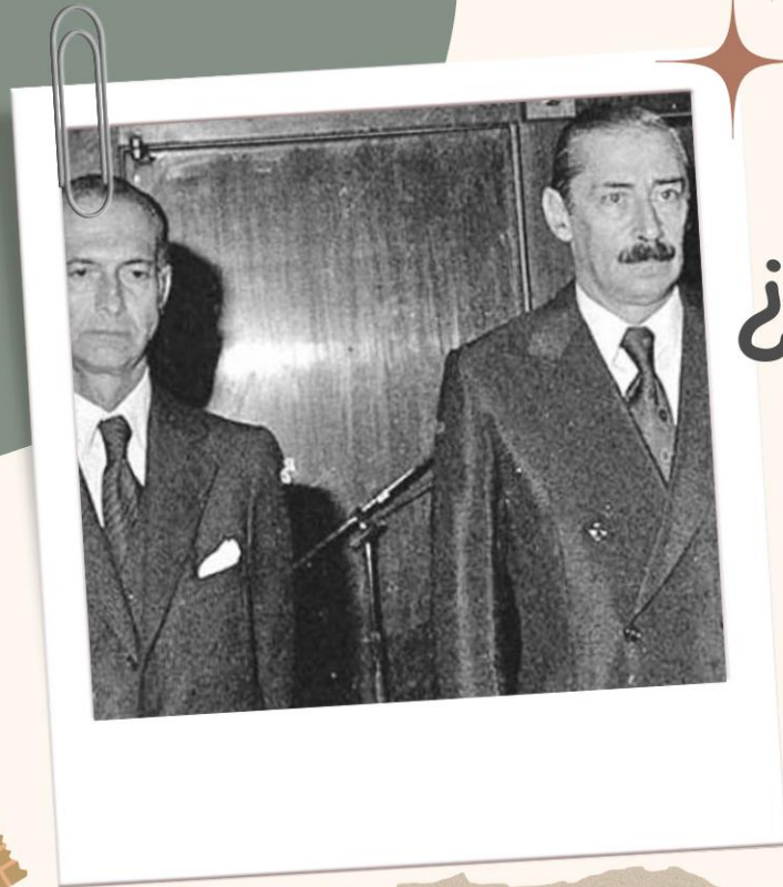
Marínez de Hoz como ministro