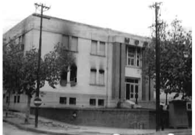
Se incendia el edificio del Ministerio de Obras Públicas. Balcarce y Bv. Illia