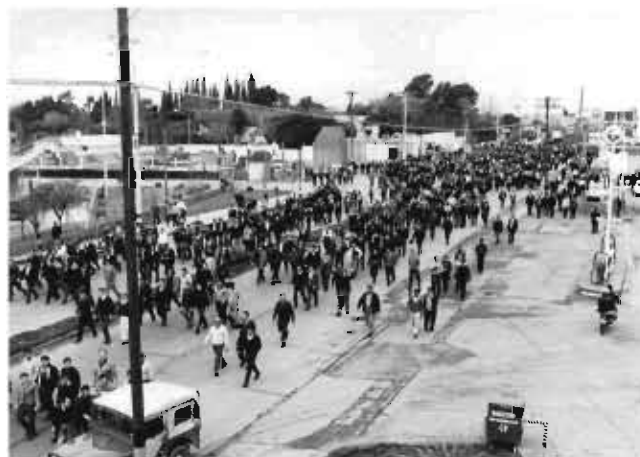
Columna de los trabajadores de SMATA, Av. Velez Sarsfield y Cruz Roja

Testimonio de Agustín Tosco, Secretario General de Luz y Fuerza de Córdoba.