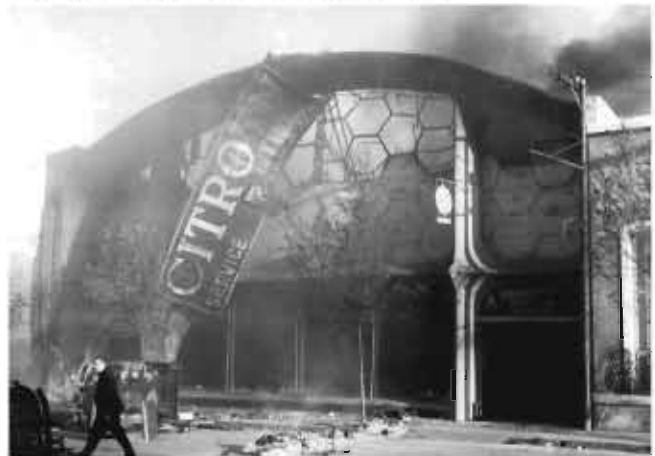
Los manifestantes queman la concesionaria de Citroen