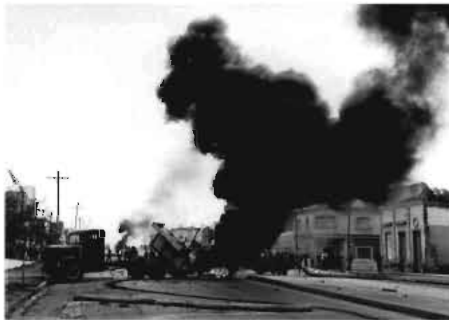
Barricada en Bv. San Juan