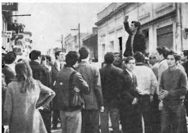
Los actos relámpago se reproducen en diferentes esquinas de la ciudad

8. En la esquina de Santa Rosa y General Paz, el acto que organiza Luz y Fuerza y otros gremios estatales es embesido por la policía. Se multiplican los enfrentamientos por toda la zona céntrica. Obreros, junto a estudiantes, organizan actos relámpago y arman barricadas en diferentes esquinas. Los manifestantes reciben el apoyo de los vecinos que le acercan objetos para quemar en las hogueras.