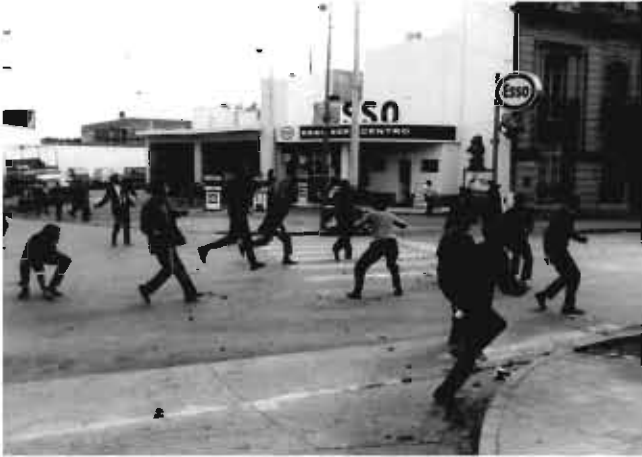
Los manifestantes hacen retroceder a la Policía en Av. Velez Sarsfield y San Luis

14. Se producen enfrentamientos en las inmediaciones de la vieja terminal de colectivos, Velez Sarfield al 600. Restos de la columna de SMATA intentan llegar al centro por Nueva Córdoba, junto a estudiantes de la zona y otros obreros de diversos gremios como AOMA, que provenían de la fábrica CorCemAr y Luz y Fuerza, desde Villa Revol. Los manifestantes hacen retroceder a la División de Caballería de la Policía de la Provincia de Córdoba. Cae gravemente herido un estudiante de arquitectura, quien fallece horas más tarde.