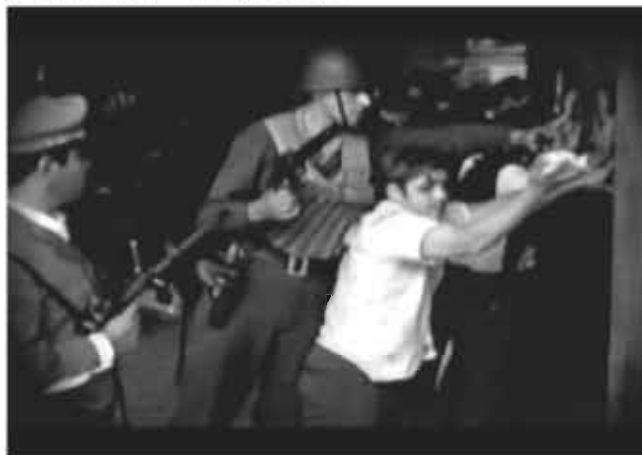
Gendarmería allana el sindicato de Luz y Fuerza