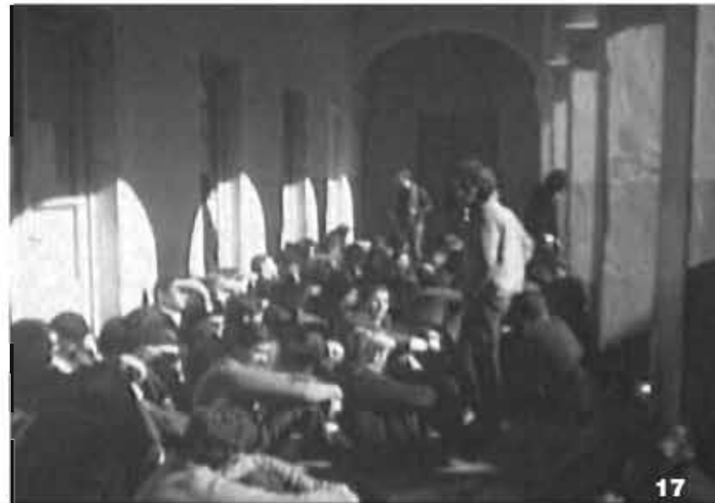
Detenidos en los patios del Cabildo

Testimonio de Agustín Tosco. Secretario General de Luz y Fuerza de Córdoba.