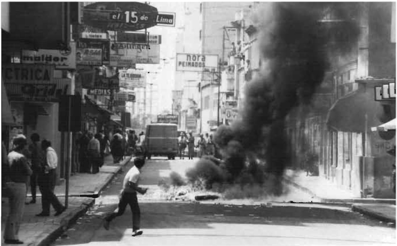
Las barricadas se arman en diferentes puntos de la ciudad, en la fotografía la calle Lima