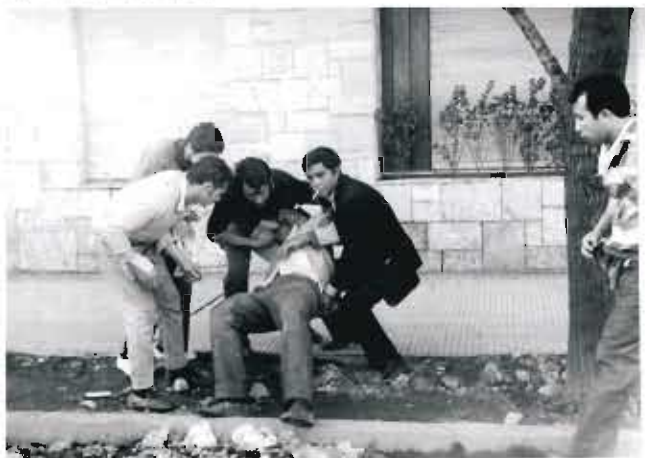
Los enfrentamientos dejan numerosos heridos como saldo