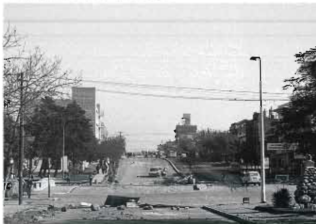
vista de Bv. San Juan y Cañada el 30 de mayo