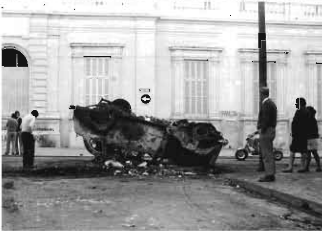
Barricada frente al hospital de clínicas