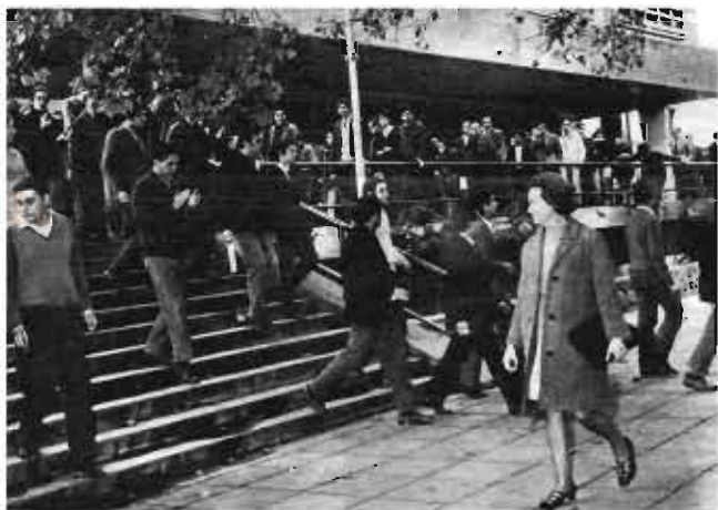
Trabajadores y estudiantes concentrados en la Municipalidad de Córdoba.

7. En la Av. Colón y General Paz un nutrido grupo de estudiantes, obreros y empleados se reúnen para entonar el himno nacional. Los manifestantes cantan consignas a favor de la CGT y en contra de la dictadura. Son reprimidos con gases lacrimógenos.