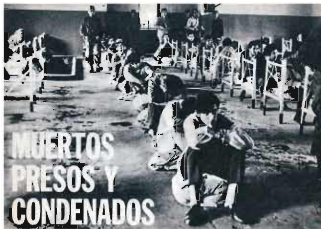
portada de la revista Así reflejando las detenciones