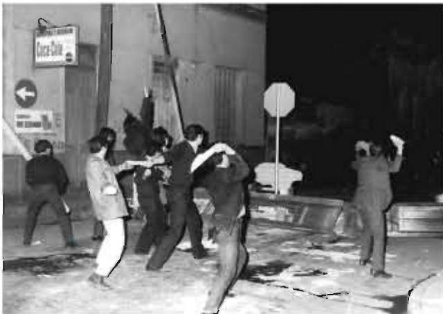
Enfrentamientos nocturnos en Barrio Clínicas

31. Es incendiado el edificio del Ministerio de Obras Públicas de la Provincia (actualmente Bv. Illia y Balcarce).