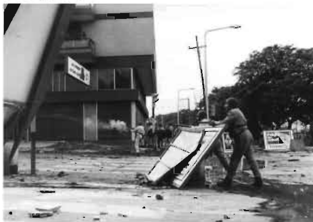
La Policía apostada en Bv. San Juan y Cañada