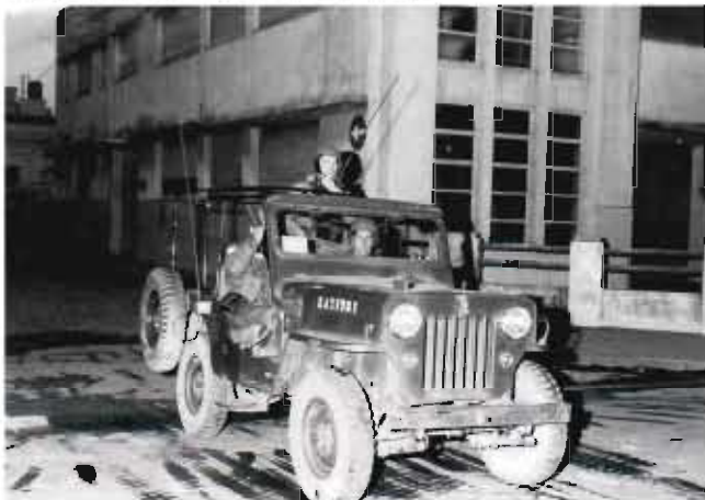
El Ejército ingresa a la ciudad

27. Ingresan a la ciudad las unidades militares de la Cuarta Brigada de Infantería Aerotransportada, de Aeronáutica, el 14 de Infantería, del Batallón de Comunicaciones, un grupo de Artillería liviana motorizada y efectivos de Gendarmería.