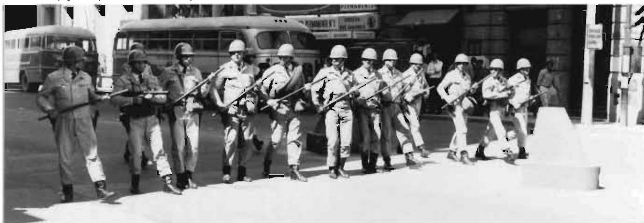
Formación de la Guardia de Infantería en Av. Colón, y Tucumán

9. Un grupo de estudiantes irrumpen en el Palacio de Justicia. Se agrupan alrededor de 1.000 personas y realizan un acto relámpago. Cantan consignas a favor de la unidad obrero-estudiantil y le piden a los empleados judiciales que se sumen a la protesta. Una vez que son desalojados por la Policía se desplazan hacia el edificio de la Municipalidad donde realizan otro acto relámpago. Allí vuelven a ser reprimidos, esta vez con gases y luego de corridas, se fortalecen en 27 de abril y Belgrano. En esa esquina arman una gran barricada y rechazan a la Policía con piedras.