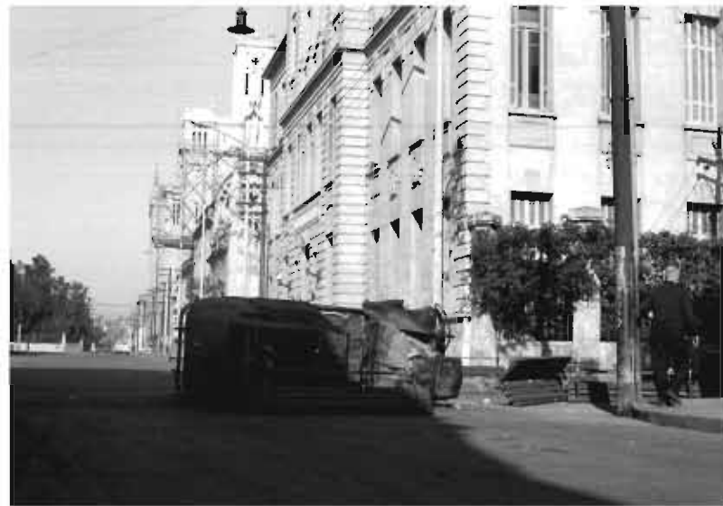
Barricada frente a la maternidad provincial en calle Santa Rosa