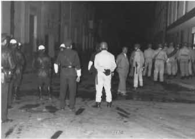
Las fuerzas de seguridad alistadas para la represión