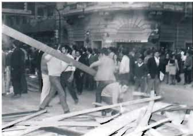
Manifestantes levantan barricadas en el centro