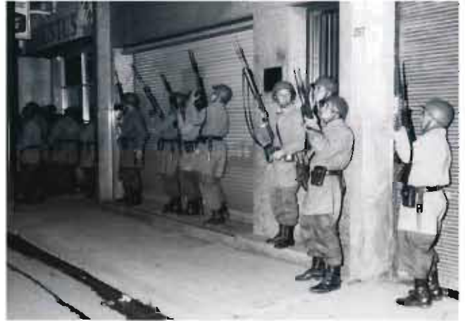
El Ejército busca el control de la ciudad