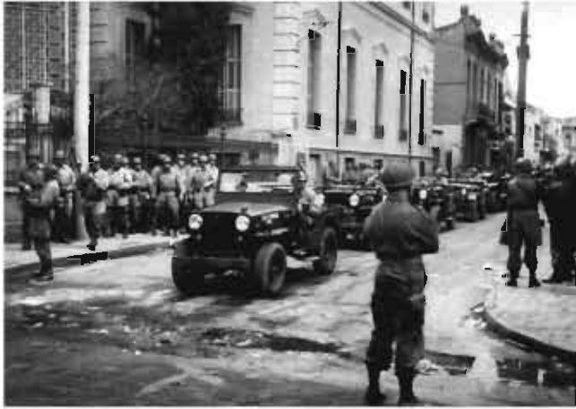
El Ejército ingresa a la ciudad, columna en Calle Rioja y Av. General Paz

25. Uno de los últimos pelotones de la guardia de infantería accede a la zona del conflicto por la calle La Rioja. En su trayecto, los policías se enfrentan con vecinos y reporteros. Entre sus acciones, arrojan bombas a domicilios particulares y enfundan sus armas sobre los periodistas. Cuando llegan a la Xerox, ya se encontraba incendiada.