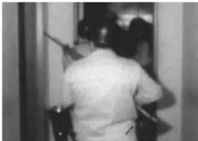
Gendarmería allana el sindicato de Luz y Fuerza