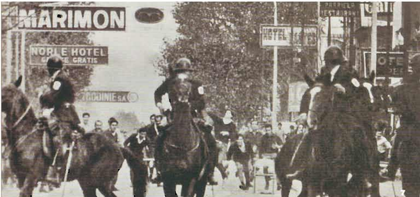
Los manifestantes hacen retroceder a la Policía en inmediaciones de la vieja terminal de colectivos