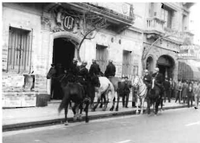
La policía al frente de la CGT

22:00 hs - 40. Se suceden enfrentamientos en el Barrio Clínicas. Las fuerzas de seguridad realizan allanamientos y detenciones.