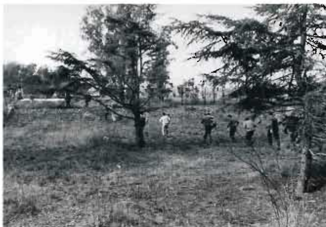
Los manifestantes se dispersan por Ciudad Universitaria

13. A raíz del enfrentamiento, la columna de los obreros del SMATA se dispersa. Un grupo minoritario se moviliza en dirección a Ciudad Universitaria y barrio Nueva Córdoba, mientras el grueso de la columna se desplaza por los barrios colindantes, Bella Vista, Güemes y Observatorio. Asimismo, la Policía se repliega en la Plaza de la Paz (actualmente Plaza de las Américas).