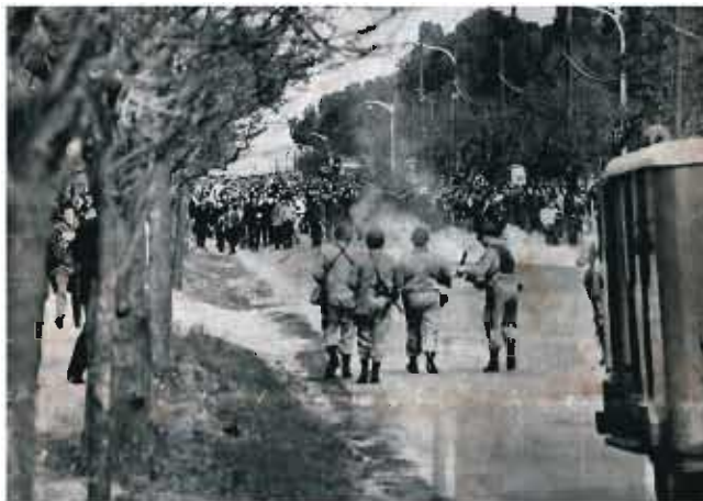
La Policía ataca a los trabajadores del SMATA.

12. En cercanías a la Escuela Hogar Pablo Pizzurno, se producen los primeros enfrentamientos con la columna que encabezaba SMATA. Alrededor de 10.000 obreros, que venían armados con honderas, bulones y mostrando gran cohesión, son atacados por un cordón policial de la Guardia de Infantería de la Policía Federal.