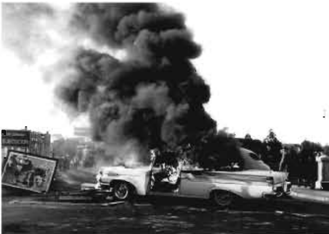
Barricada en el puente avellaneda