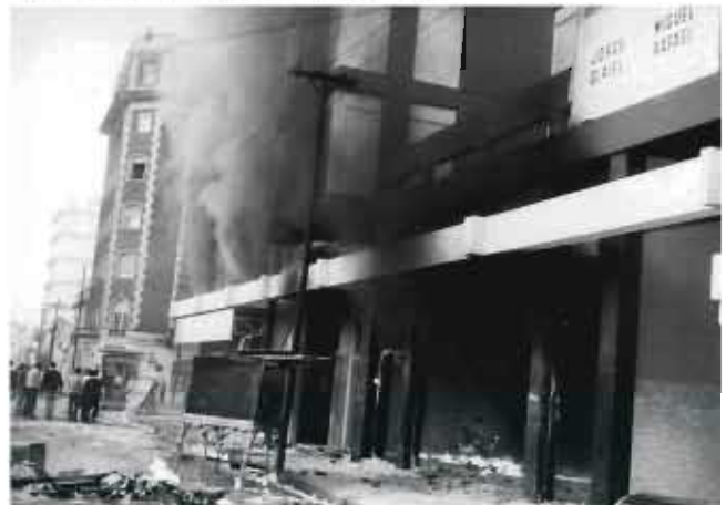
Incendio en el edificio de la empresa Xerox