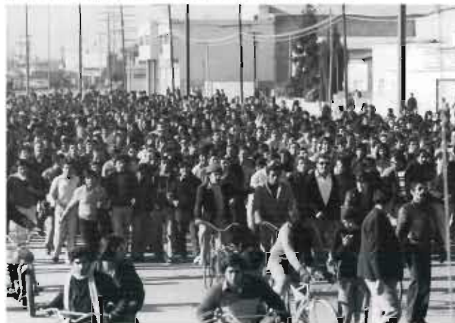
Desde horas tempranas los trabajadores se movilizan hacia el centro