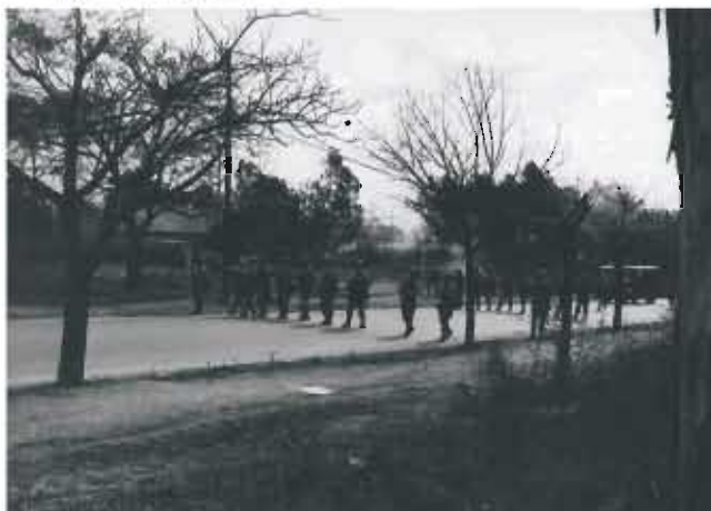
La Policía ataca a los trabajadores del SMATA.