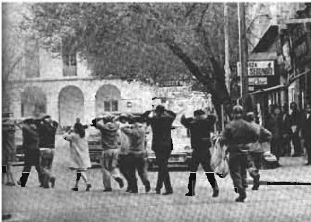
Detenidos llevados a la jefatura de la policía por la plaza San Martín

33. Continúa la resistencia en Barrio Clínicas. Se levantan barricadas, incendiando un se incendia un ómnibus de transporte público en Santa Rosa y Río Negro .