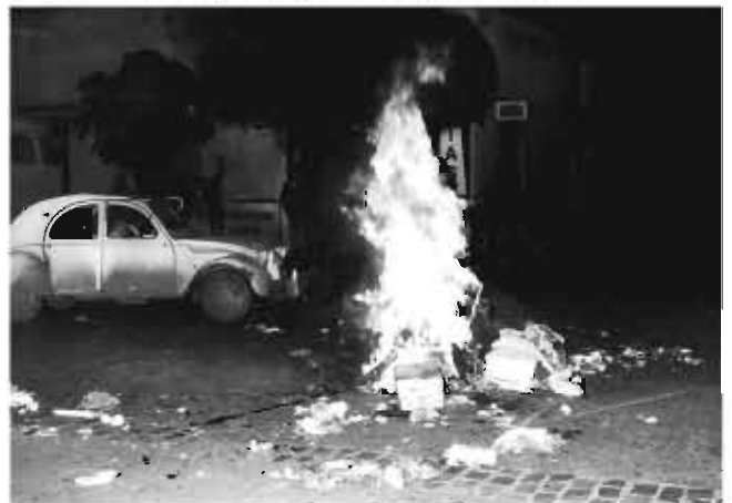
Barricada nocturna en calle Santa Rosa