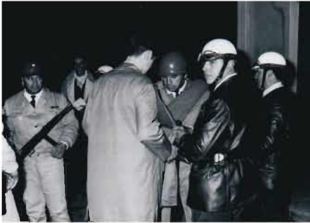
Las fuerzas de seguridad realizando controles