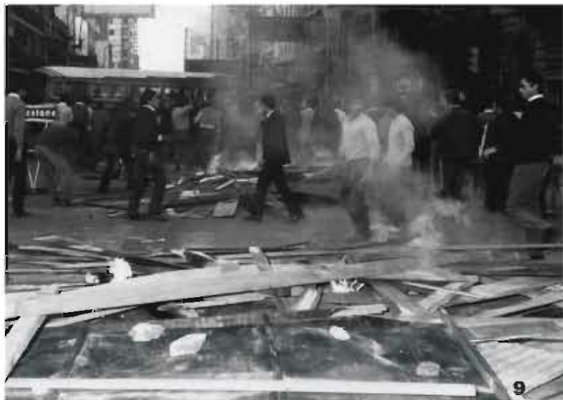
Manifestantes levantan barricadas en el centro

Testimonio de Agustín Tosco. Secretario General de Luz y Fuerza de Córdoba.