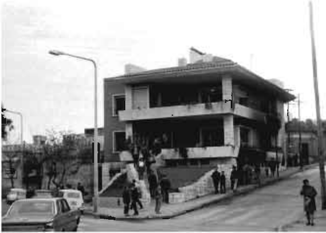
En San Luis y La Cañada se incendia el Circulo de Suboficiales, fotografía del día después

21. Los estudiantes se agrupan en los alrededores del Hospital Nacional de Clínicas. Por la avenida Colón, desde la Cañada hasta Mendoza, se organiza una barricada en cada esquina. La Plaza Colón sirve como nexo entre los manifestantes que desarrollan los enfrentamientos en la zona céntrica y el barrio Clínicas.