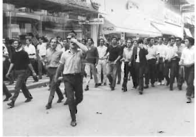
Los estudiantes se manifiestan por el centro de la ciudad

19. Obreros y estudiantes enfrentan a la policía, las corridas se desarrollan por la Maipú y en la zona del Hospital San Roque.