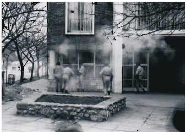
La policía reprime con gases