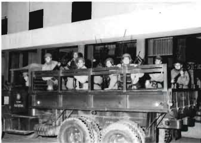
El Ejército ingresa a la ciudad, camión con conscriptos

26. La policía se encuentra desbordada por los manifestantes. Aviones militares realizan vuelos rasantes. Es inminente la llegada de las fuerzas del Tercer Cuerpo de Ejército para ocupar la ciudad.