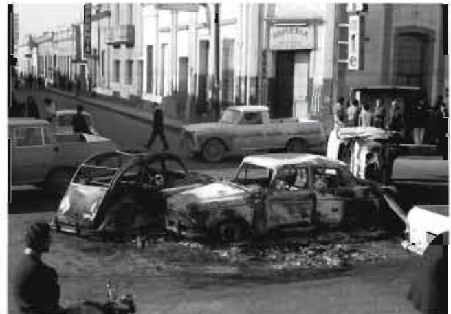
Barricada en Av. Colón