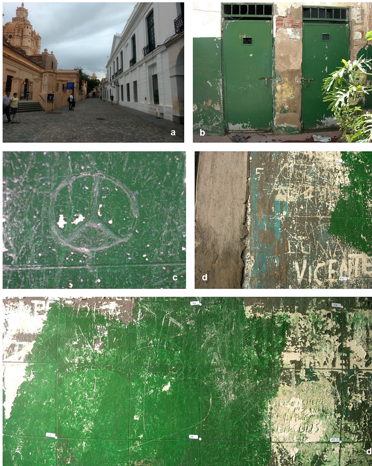
Figura 3. Archivo Provincial de la Memoria de Córdoba, ex D2. (a) contexto urbano del emplazamiento del sitio de memoria y archivo; (b) puertas de los calabozos con grafitis; (c), (d) y (e) detalles de grafitis o inscripciones.