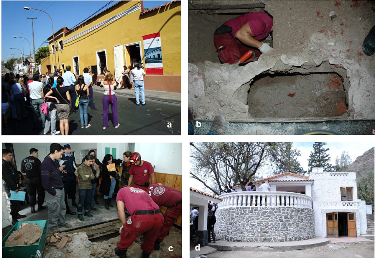
Figura 4. Otros lugares de detención: (a) sede Mariano Moreno de la ex D2, en el momento de su inauguración como sitio de memoria; (b) y (c) detalles de la excavación del sótano del mismo sitio; (d) la Casa de Hidráulica, en el Dique San Roque, Córdoba (las imágenes a, b y c fueron tomadas de https://apm.gov.ar/apm/casona-de-mariano-moreno ).

trabajado en realidad con hechos, tiempos y personas. Hemos trabajado con una materialidad particular, que no sólo participó y participa en ensambles mayores llenos de sentidos, sino que tiene una fuerza propia de por sí y que no sólo está en lugar de otra cosa (evidenciando, significando, recordando...etc.), sino que es la cosa misma en sí. Estas experiencias nos permiten compartir una serie de reflexiones sobre el registro arqueológico de desapariciones y sobre qué y cómo podemos contar desde allí.