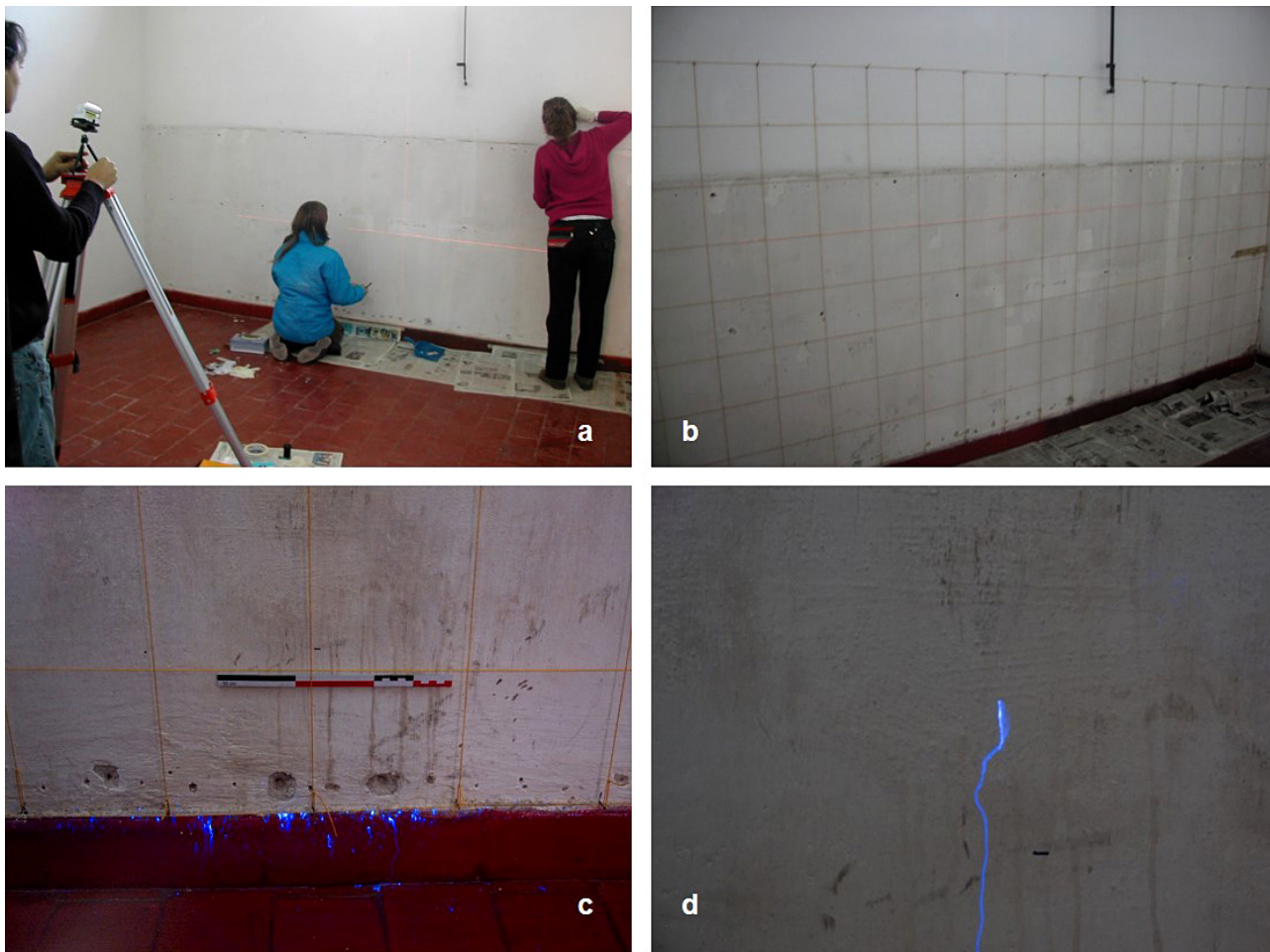
Figura 2. Imágenes de la recuperación de vestigios de fluidos corporales en Iso espacios de interrogatorios u “oficinas”. (a) planteo de cuadrículas para la exploración del muro, (b) cuadrículado de referencia; (c) y (d) resultados de la aplicación de reactivo quimioluminiscente en las superficies originales descubiertas. El color azul se debe a la reacción del producto con sangre humana.

de Córdoba, conocido como “la D2” (Comisión y Archivo Provincial de la Memoria, 2009).